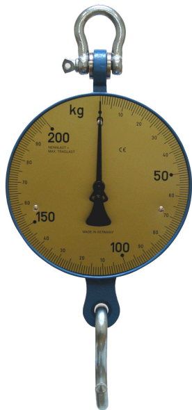
Typ 20 ohne Plexiglasschutz vor der Skala